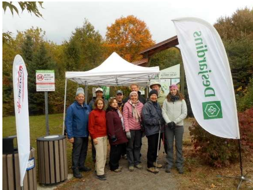
Mon massif en automne, octobre 2019.