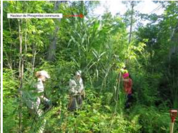
Éradication du phragmite commun, plante exotique envahissante.