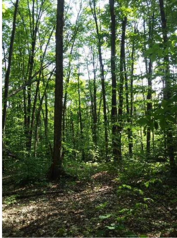
Terrain nouvellement protégé.