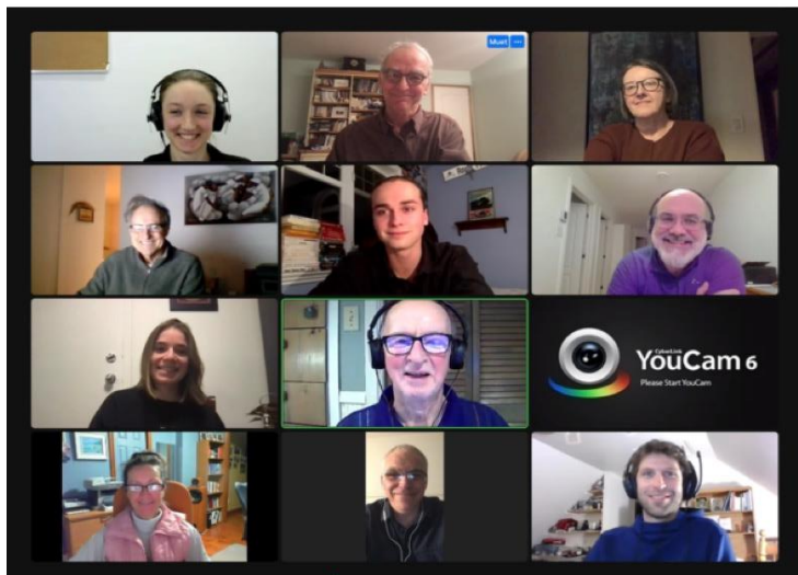
Capture d'écran lors de l'élection par Zoom le 10 mars 2022