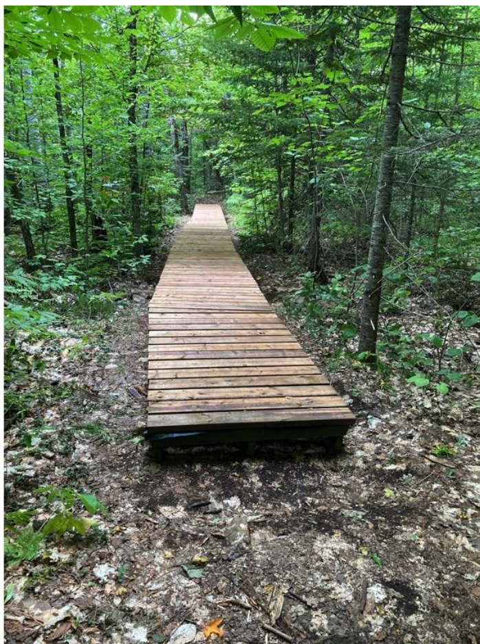
Passerelle du sentier écologique à Saint-Hippolyte